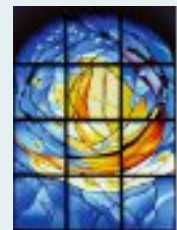
Coverbild: Das Schiff Kirche inmitten der Weltmeere im Wandel der Zeiten.

„Der Geist des Herrn erfüllt das All“ von Edith Temmel, Glasfenster auf der Orgelempore der Franziskanerkirche.